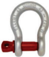
G-209 / S-209

G-209 Los grilletes tipo ancla con perno roscado cumplen con la Especificación Federal RR-C-271F Tipo IVA, Grado A, Clase 2, excepto por las estipulaciones exigidas del contratista. Para mayores informaciones vea la página 444.